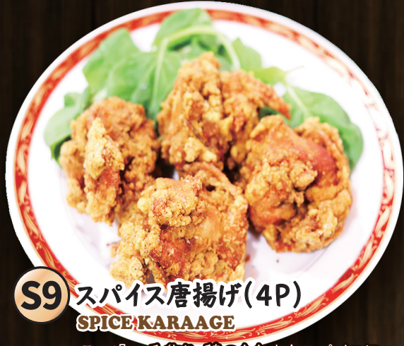
S9 スパイス唐揚げ(4P) SPICE KARAAGE

その場で手作り。鶏のもも肉をスパイスに漬け込み、オリジナルのスパイス粉をつけて揚げたスパイシーな唐揚げ。