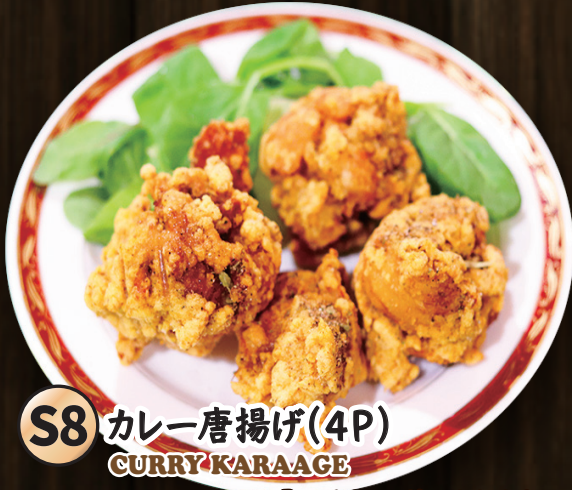
S8 カレー唐揚げ(4P) CURRY KARAAGE

その場で手作り。鶏のもも肉をスパイスに漬け込み、カレー粉をつけて揚げたカレー風味の唐揚げ。