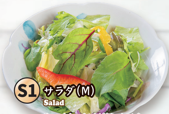
S1 サラダ(M) Salad