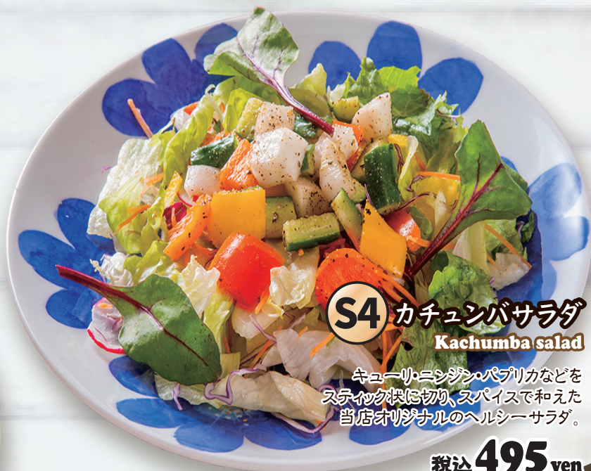
S4 カチュンバサラダ Kachumba salad

キューブ・ニンジン・パプリカなどをスライスカットに切り、スパイスで和えた当店オリジナルのヘルシーサラダ。