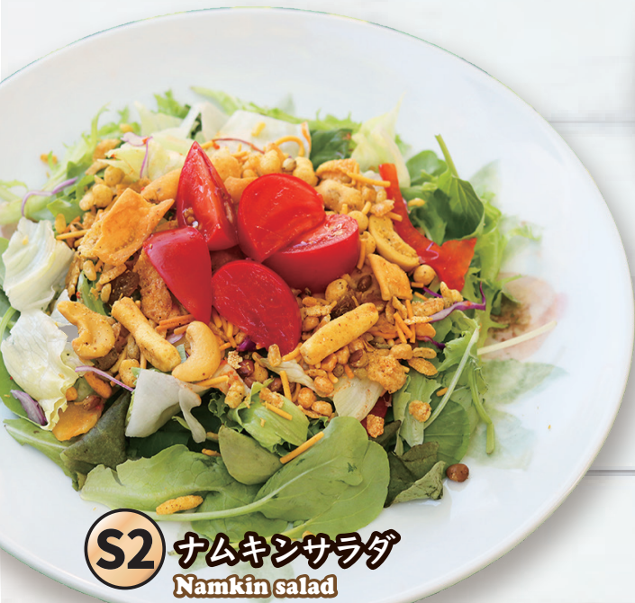
S2 ナムキンサラダ Namkin salad