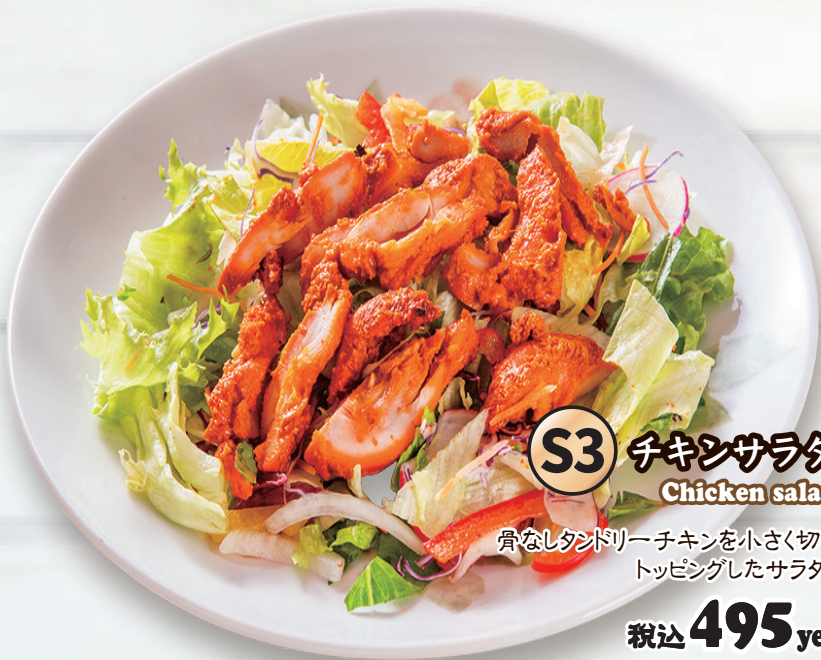
S3 チキンサラダ Chicken salad