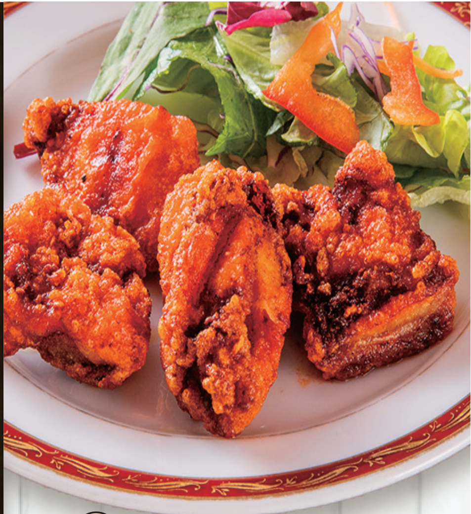
S10 タンドリーチキン唐揚げ(4P) TANDOOR CHICKEN KARAAGE

ヨーグルトと香辛料に漬け込んだ鶏肉を、オリジナルの粉をつけて揚げたタンドリーチキン味の唐揚げ。