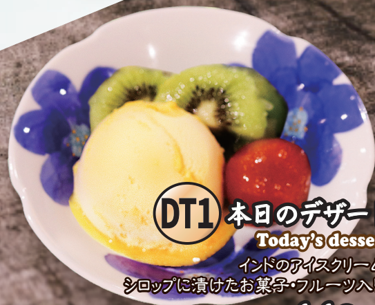
DT1 本日のデザート Today's dessert