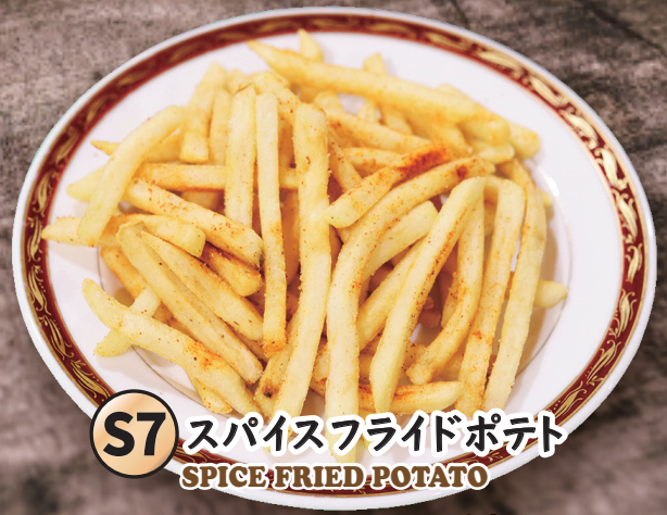
S7 スパイスフライドポテト SPICE FRIED POTATO