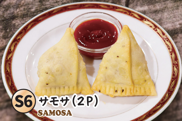
S6 サモサ(2P) SAMOSA

茹でてつぶしたジャガイモなどの具をクミンやコリアンダー、ターメリックなどの種香辛料で味付けし、小麦粉と塩と水で作った薄い皮で三角形に包み、油でさっくり揚げたもの。